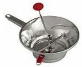
moulin à légume