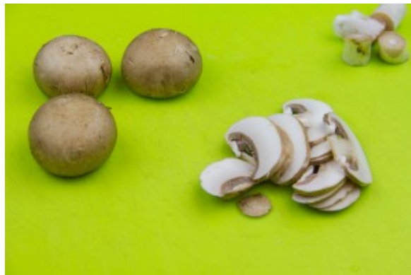
Nettoyez et coupez les champignons