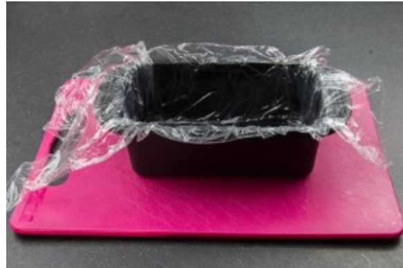
Filmez votre terrine