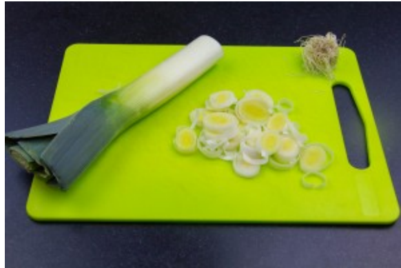
Coupez et nettoyez le poireau