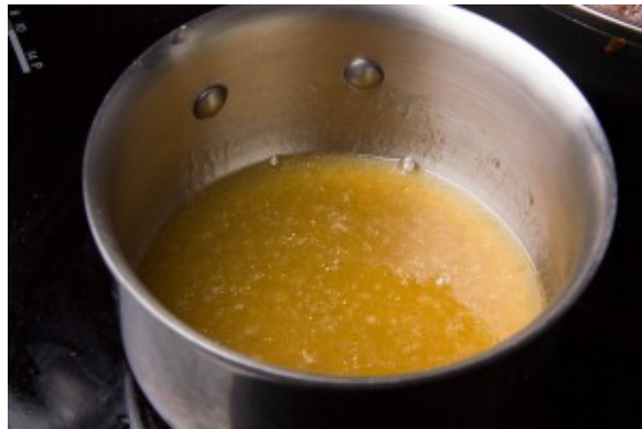
Faire réduire aux 2/3 avec du vinaigre balsamique