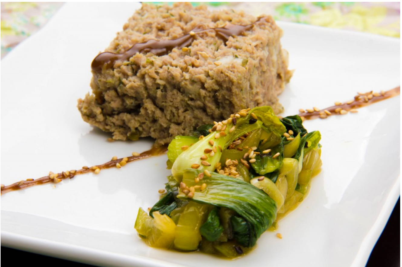
Pain de viande sur son lit de pak choi

Aujourd'hui je vous le présente sur une salade de choux pak choi ( petit chou chinois) agrémenté d' une sauce au soja et sésame...pour varier les plaisirs.