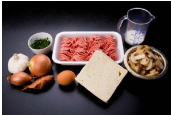
Ingrédients pain de viande