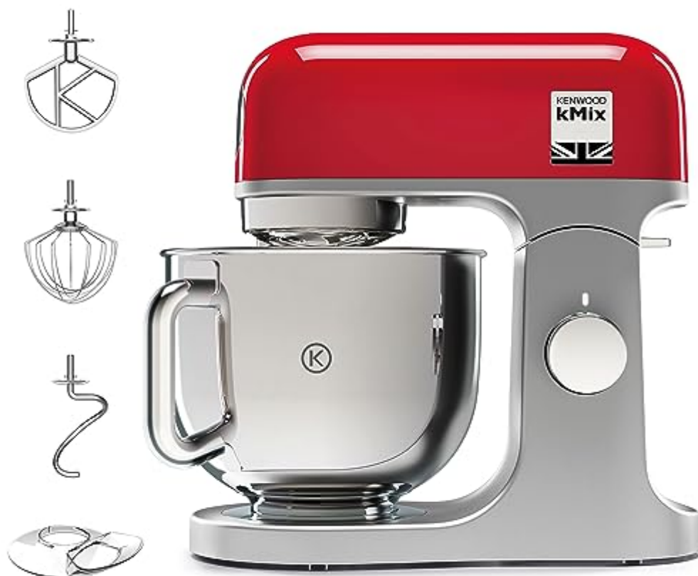
Robot pâtissier KENWOOD KMX750RD - Rouge - 1000 W - 5 L