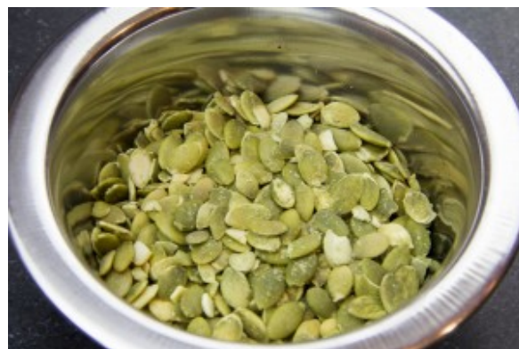
Graines de courge