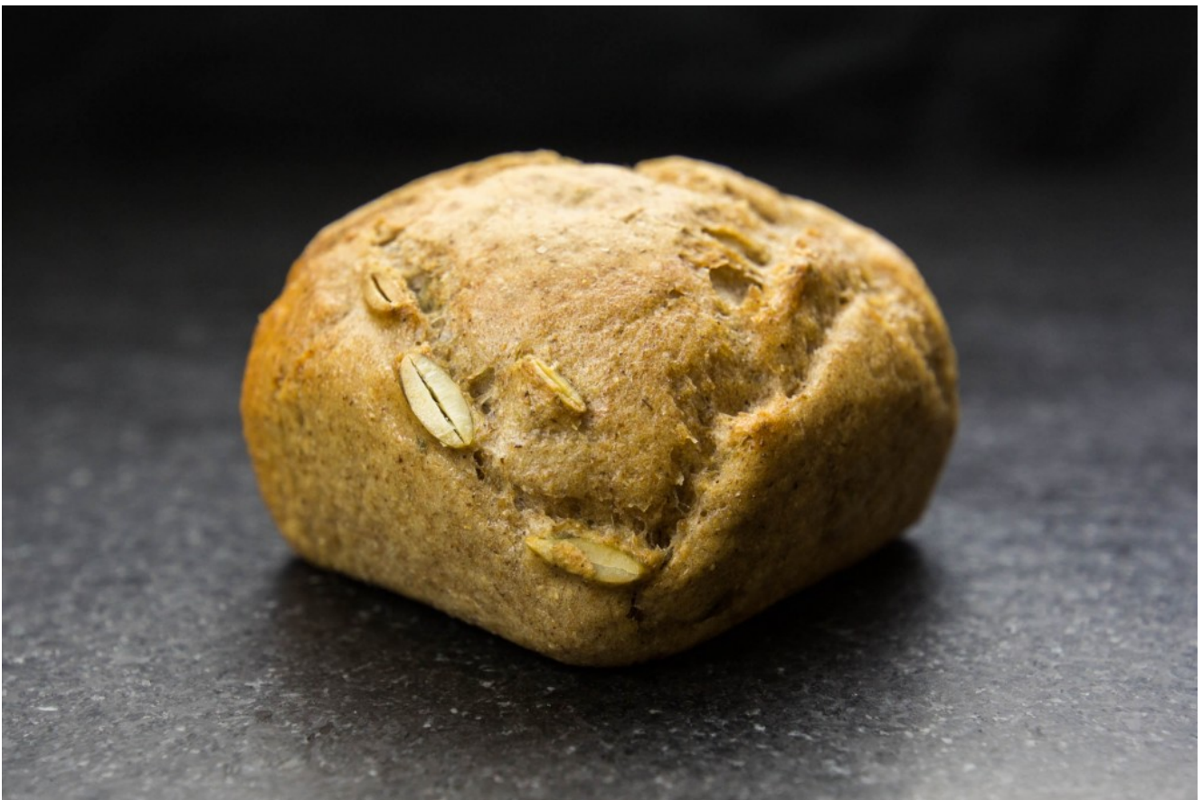
Pain vapeur aux graines de courge

Voici une recette de pain originale que vous pourrez adapter à votre goût en fonction de vos préférences. Il présente une mie dense et moelleuse qui absorbe bien les sauces. De plus il est facile à faire et se conserve très bien. Vous pouvez le congeler sans aucun souci : il gardera toutes ses qualités.