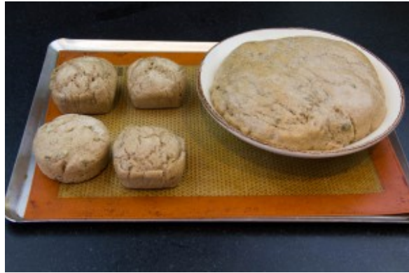
Pains à la sortie de la cuisson vapeur