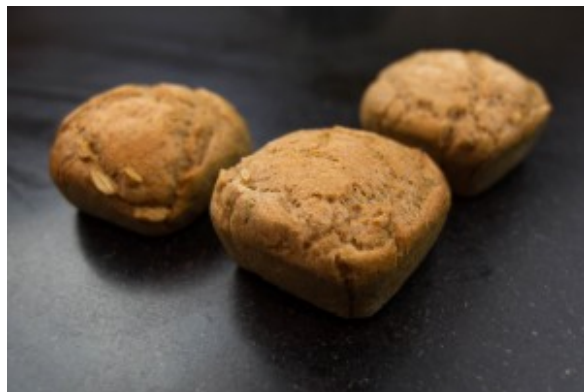
Les pains à la sortie du four