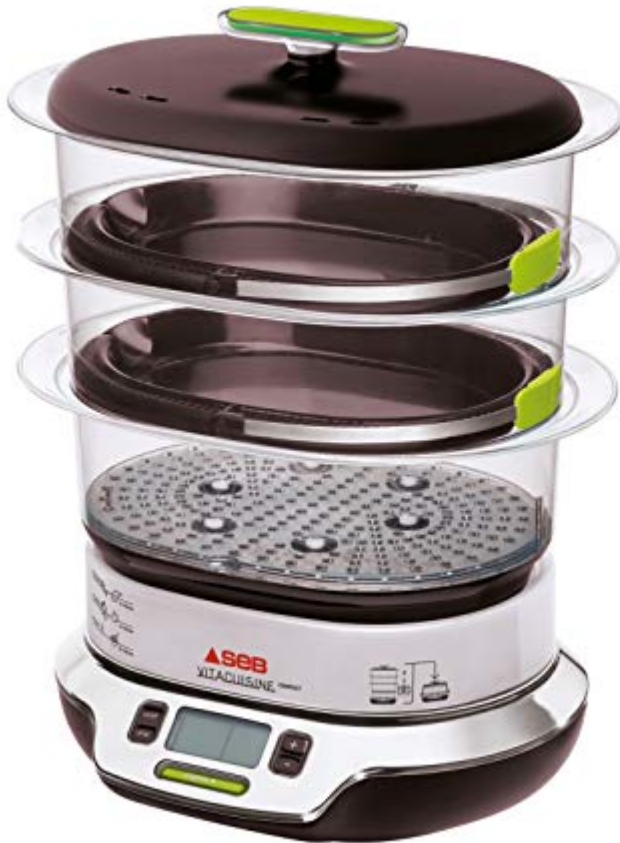
Cuiseur vapeur VS404300 Vitacuisine