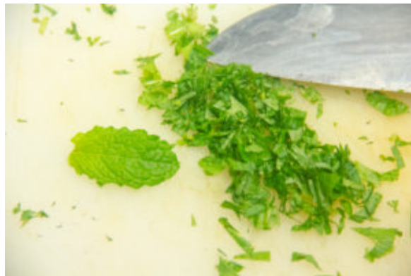
Ciselez quelques feuilles de menthe