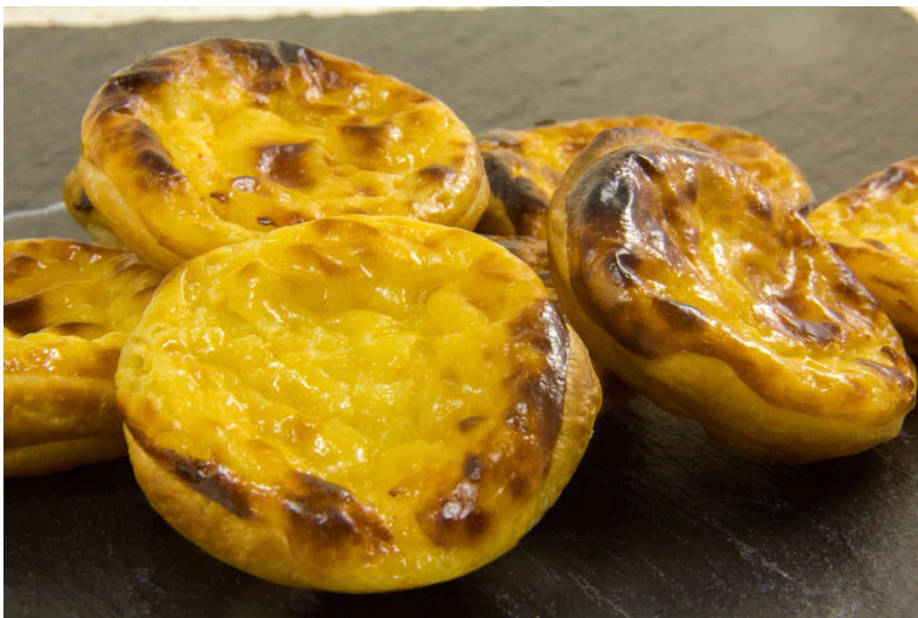
Pasteis de nata

Ces tartelettes sont cuites dans des petits moules spéciaux mais vous pouvez tout à fait utiliser vos propres moules à tartelettes. Je réalise les miennes dans un moule à tartelettes en silicone (Moule 12 Tartelettes FLEXIPAN® ORIGINE).