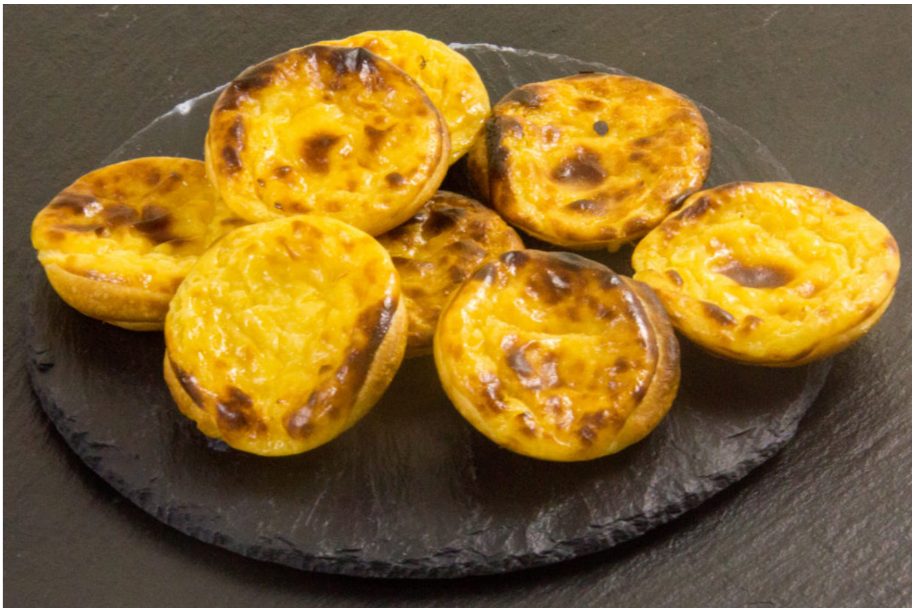
Pasteis de nata