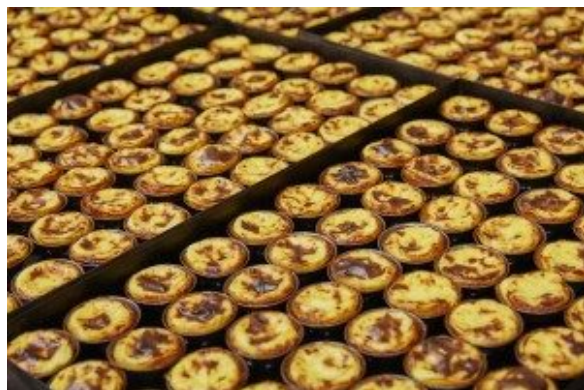
Pasteis de Belem

Lisboa Portugal . Pour une visite virtuelle de la célèbre boutique cliquez ici .