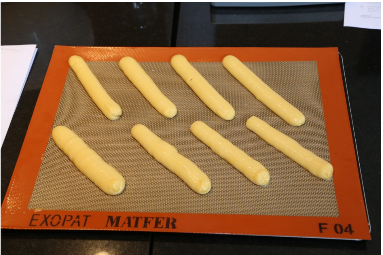
Bon écartement des éclairs