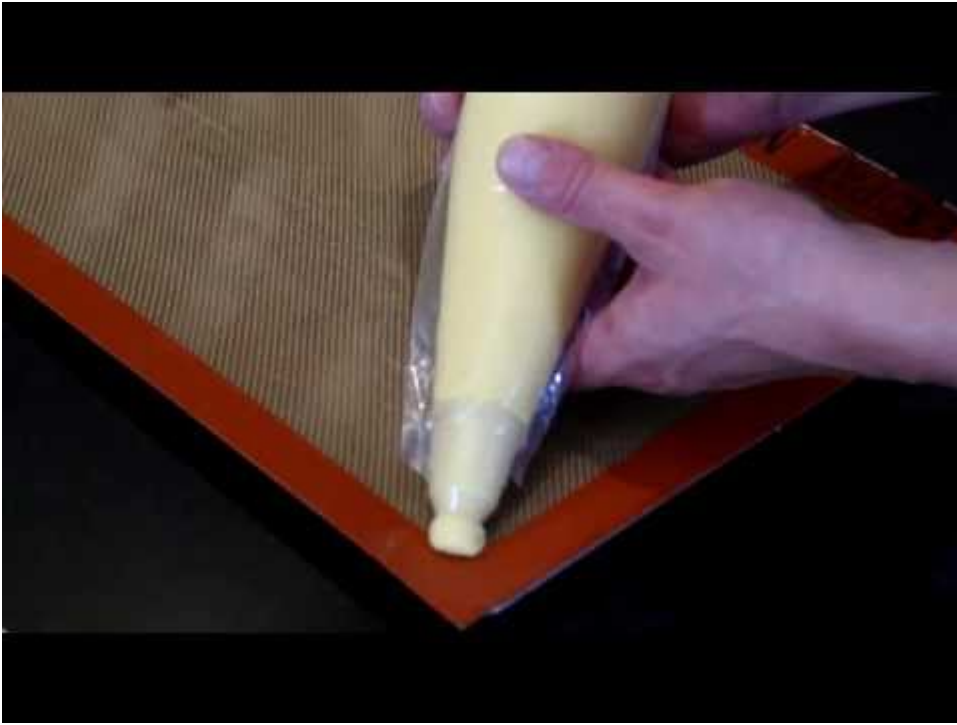
Bon écartement des éclairs: