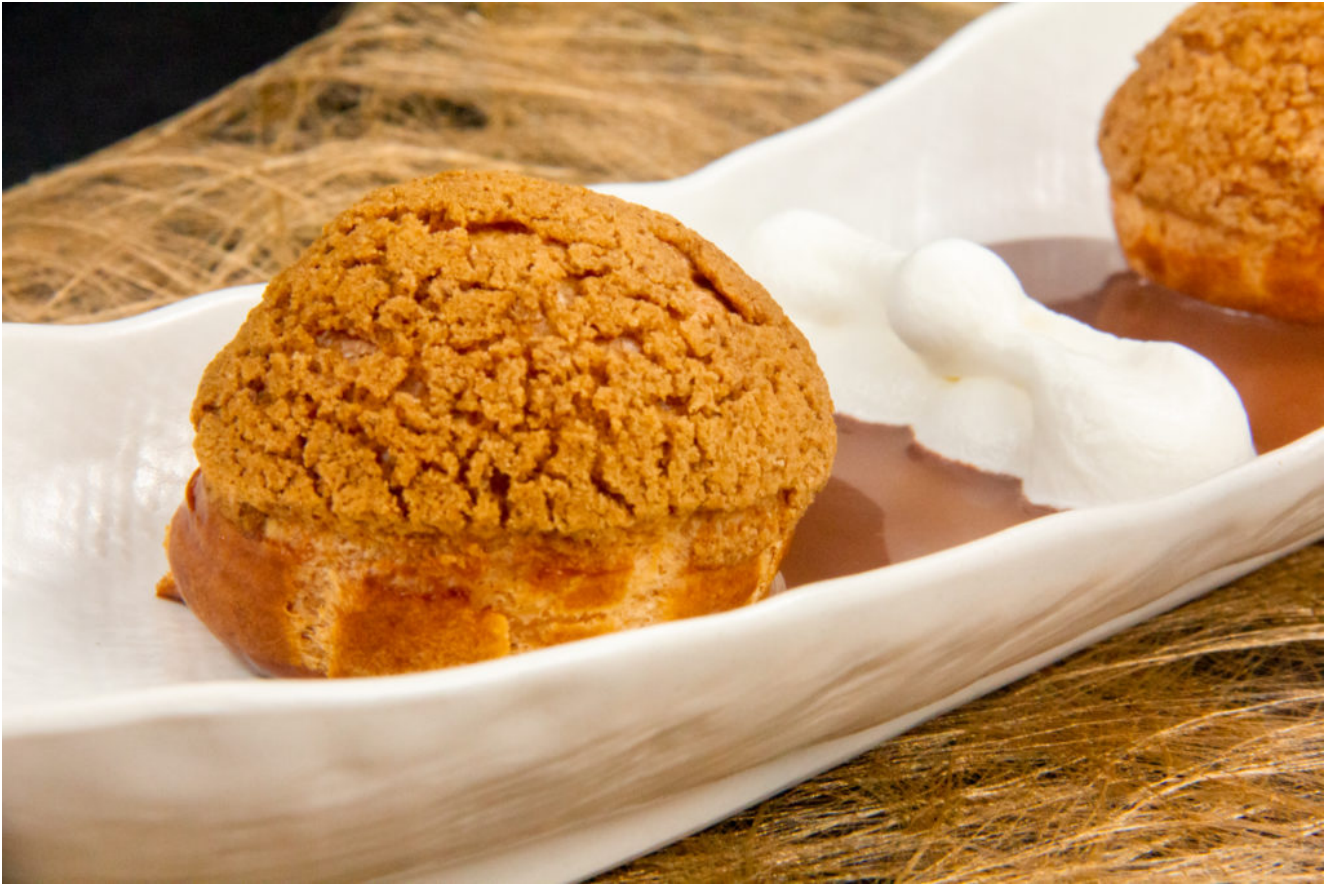
Petits choux chantilly, sauce chocopralinée