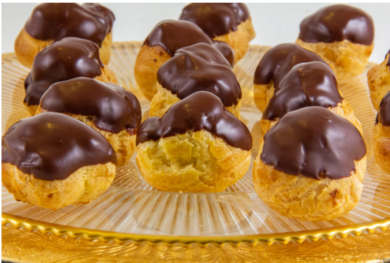
Petits choux vanille et chocolat

Pour la recette adaptée au Thermomix cliquez ICI