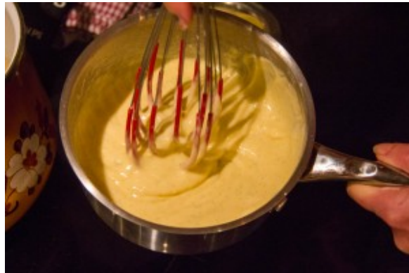
La crème épaissie