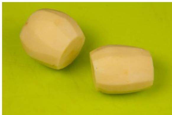
Coupez les extrémités