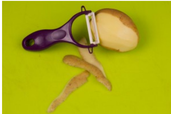
Épluchez les pommes de terre