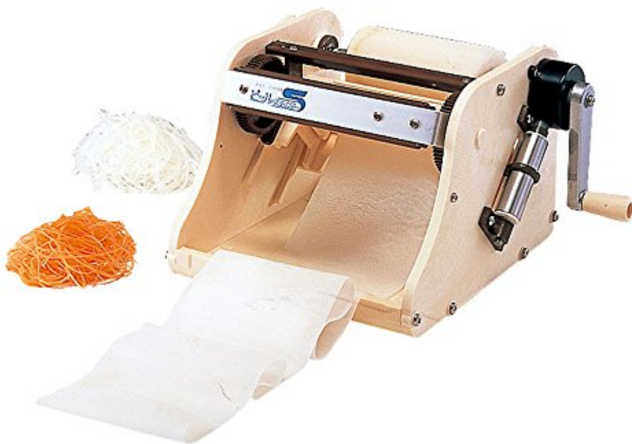
Chiba Trancheuse rotative Peel S