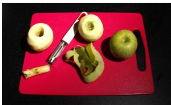
Pelez les pommes