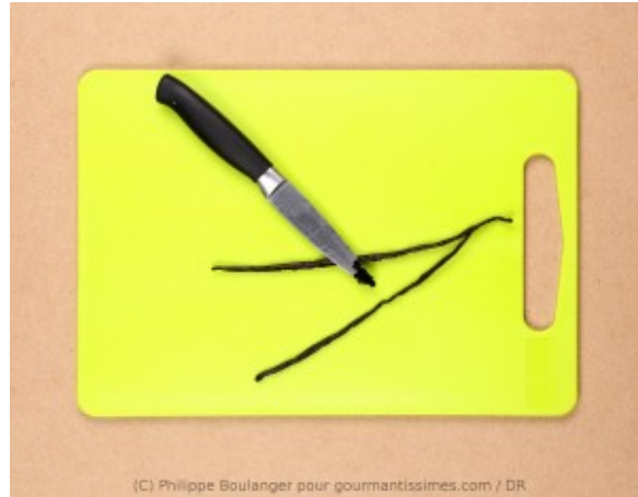
gratter la gousse de vanille