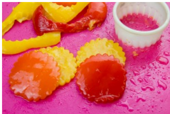
Découpez les poivrons en cercle