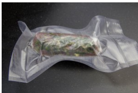
Mettre sous vide