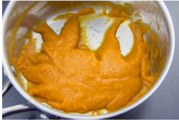
Réduire la sauce tomate