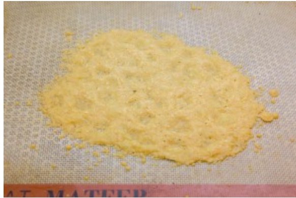
Tuile de parmesan