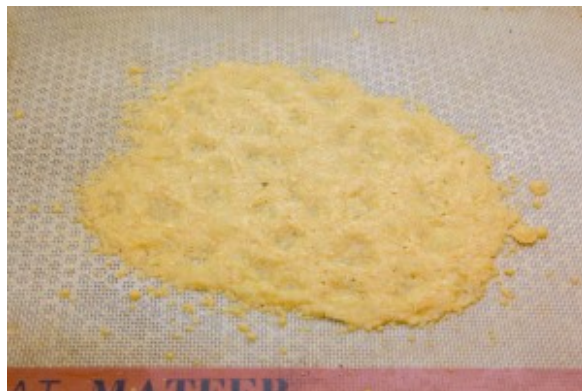
Tuile de parmesan