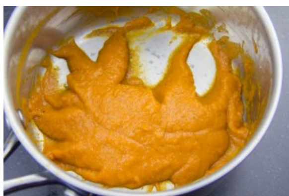
Réduire la sauce tomate