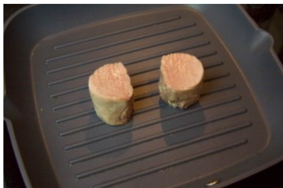
Marquez les extrémités des pièces de viande

Profitez en pour préchauffer vos assiettes de service au four à la même température (55°): vous garderez ainsi plus longtemps votre viande chaude.