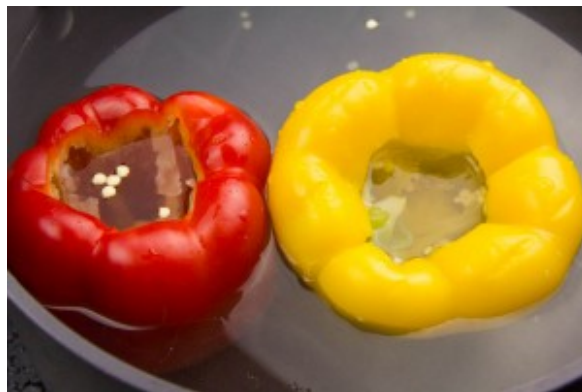
Cuire les poivrons