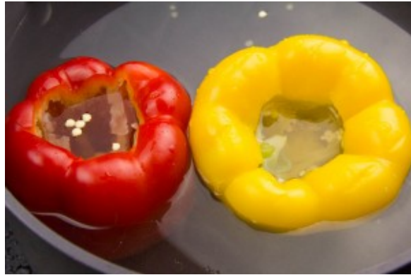
Cuire les poivrons