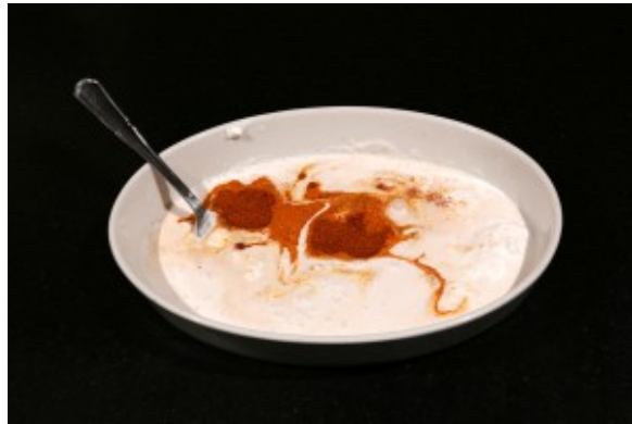
Préparez la marinade