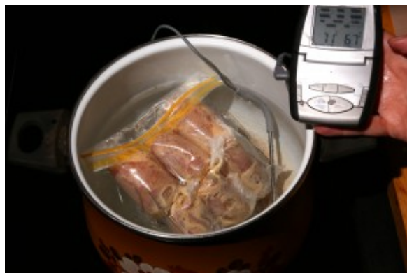
Cuisson du poulet