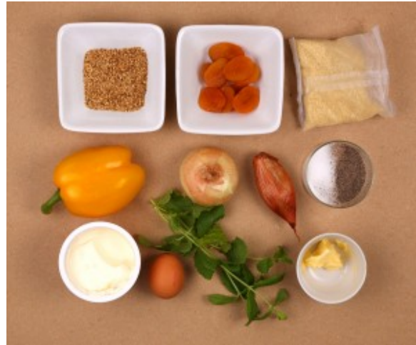
Ingrédients garniture et sauce