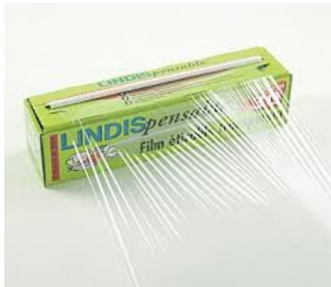
film alimentaire étirable

Ou si vous désirez vous équiper avec le matériel spécifique basse température: