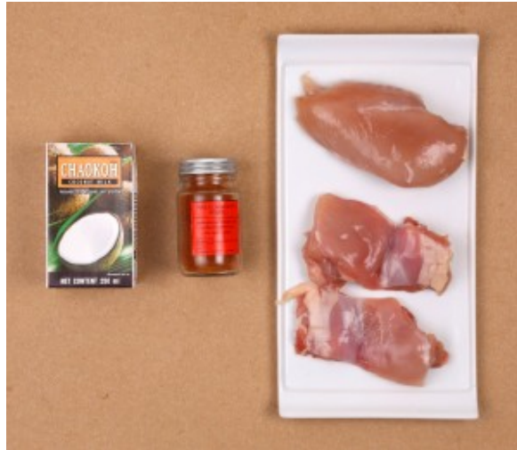
Ingrédients pour le poulet