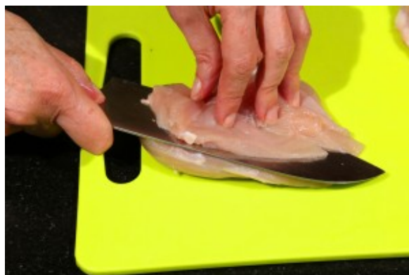
Taillez les blancs de poulet en fines escalopes