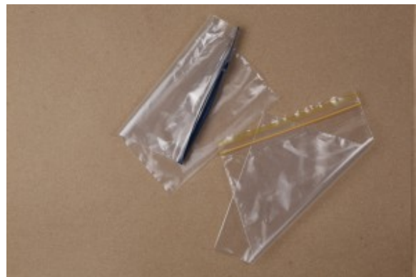
choix du bon sachet