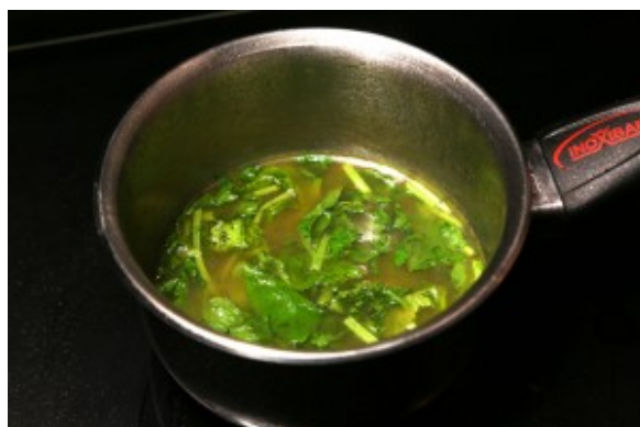
Rajoutez la menthe ciselée