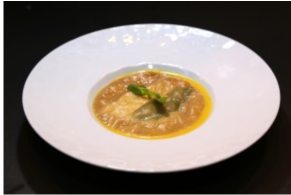
Raviole chèvre-basilic, coulis de poivron jaune et huile d'argan

Vous trouverez la recette de la raviole ici .