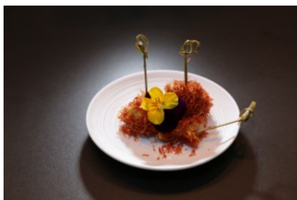
Sucettes de gambas en kadaïf

Nous avons ainsi réalisé les plats suivants: