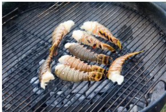
Cuire les langoustes au barbecue

http://www.weber.com/FR/fr/grill-academy/emplacements/