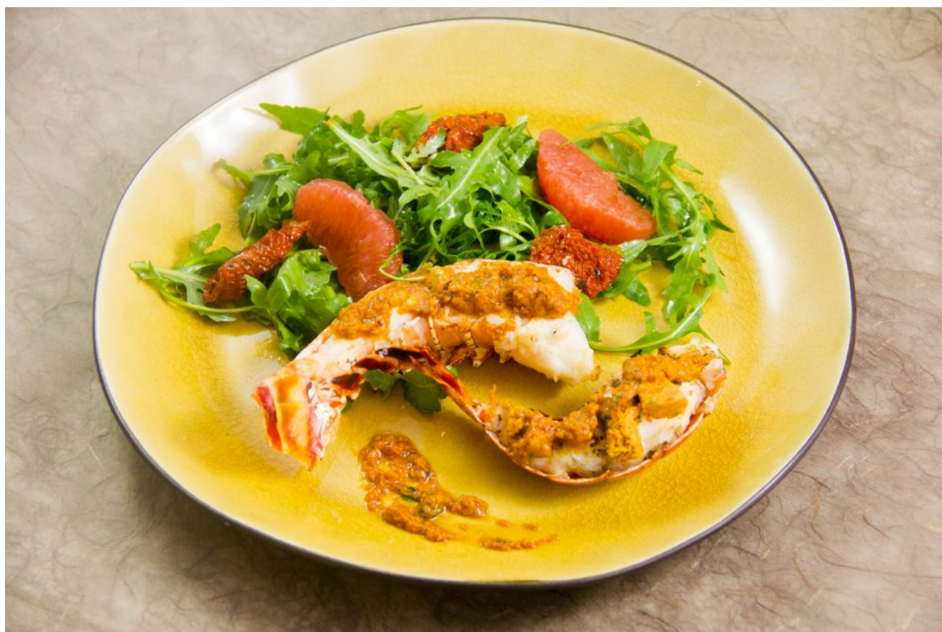
Queues de langouste au barbecue, beurre de tomate et citron confit