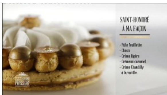
Saint Honoré à ma façon