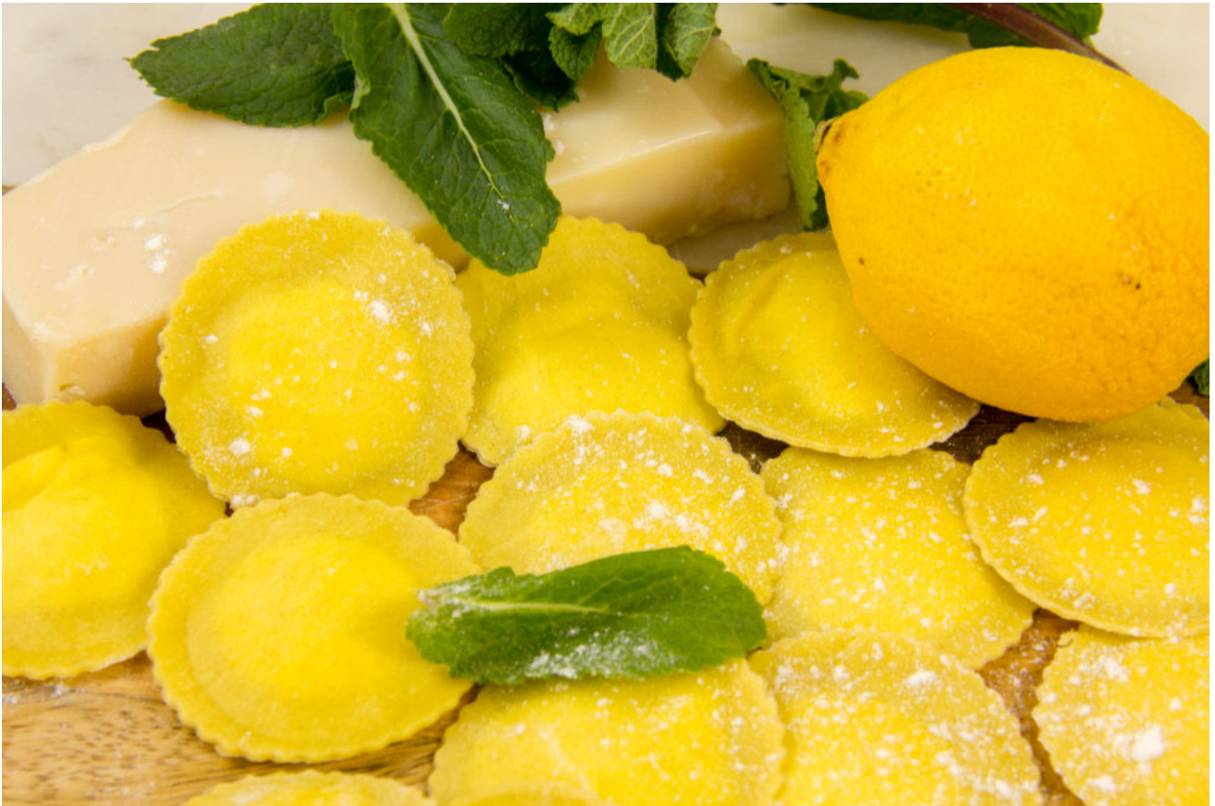
Ravioles aux trois fromages du chef Zanoni