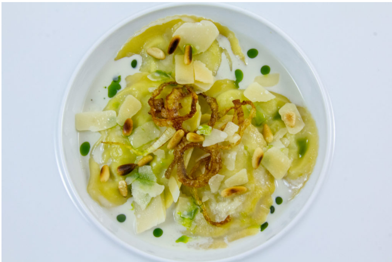
Ravioles brocoli poire, sauce gorgonzola

Une recette très gourmande que ces Ravioles brocoli poire, sauce gorgonzola...Un superbe plat végétarien. Vous allez vous régaler!