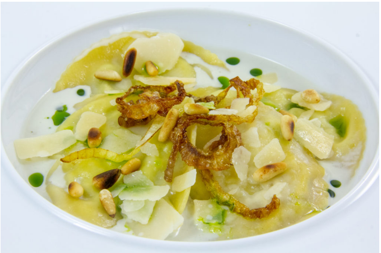
Ravioles brocoli poire, sauce gorgonzola