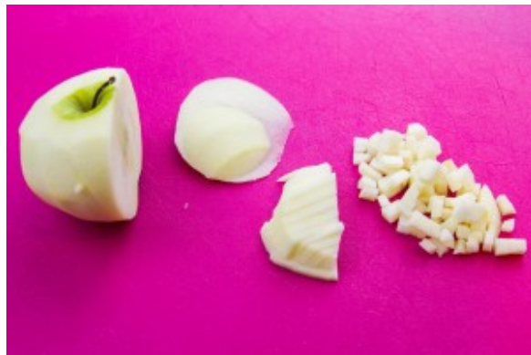
Coupez la pomme en petits dés