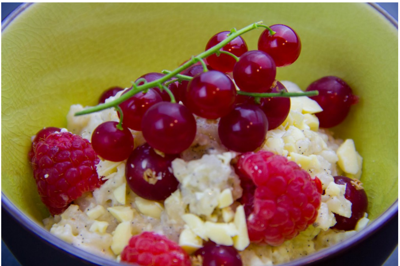
Riz au lait à la vanille, lait de coco et fruits rouges

C'est l'été et la pleine saison des fruits rouge commence, profitons-en! Cette recette de riz au lait est extrêmement savoureuse car l'acidité des fruits vient équilibrer son côté sucré. Alors faites vous plaisir en revisitant ce dessert d'enfance hyper gourmand!