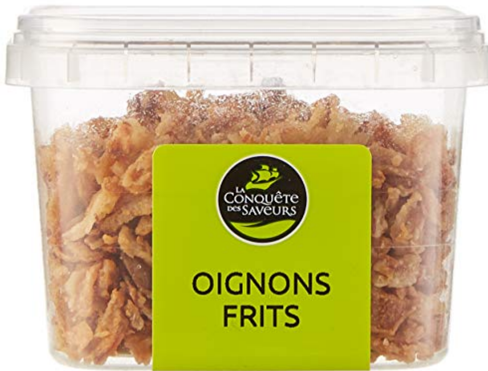
La Conquête des Saveurs Oignons Frits 50 g