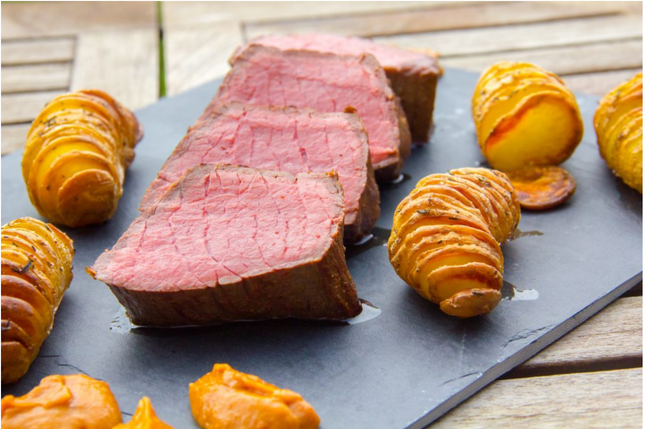
Rôti de boeuf basse température et ses pommes de terre en éventail