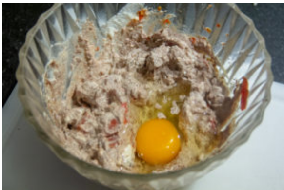
Mélangez l'ensemble des éléments de la farce