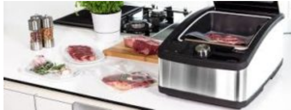
Home de Multivac

l'achat d'une sous videuse à cloche d'excellente qualité je vous conseille l'achat de la Home de Multivac. Vous la trouverez en cliquant ici et profitez d'une réduction de 50 euros sur votre achat en utilisant le code promo "Gourmantissimes50"