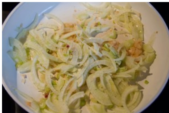
Faire revenir les échalottes et le fenouil.