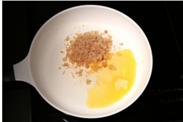
Faire revenir les échalottes avec une noix de beurre