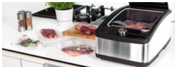
Home de Multivac