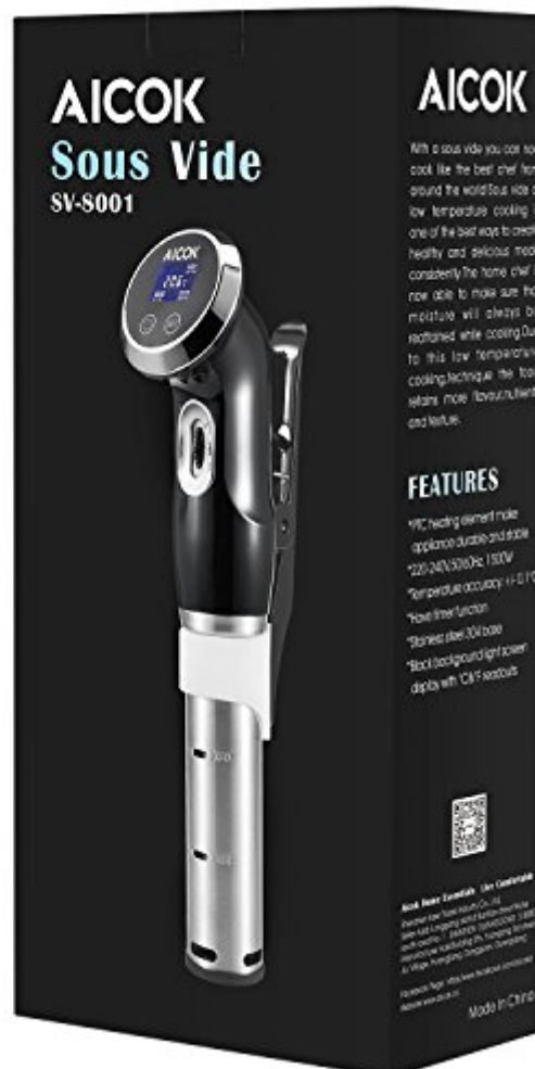
Aicok Cuiseur Sous Vide 1500W Calculateur d'Immersion de