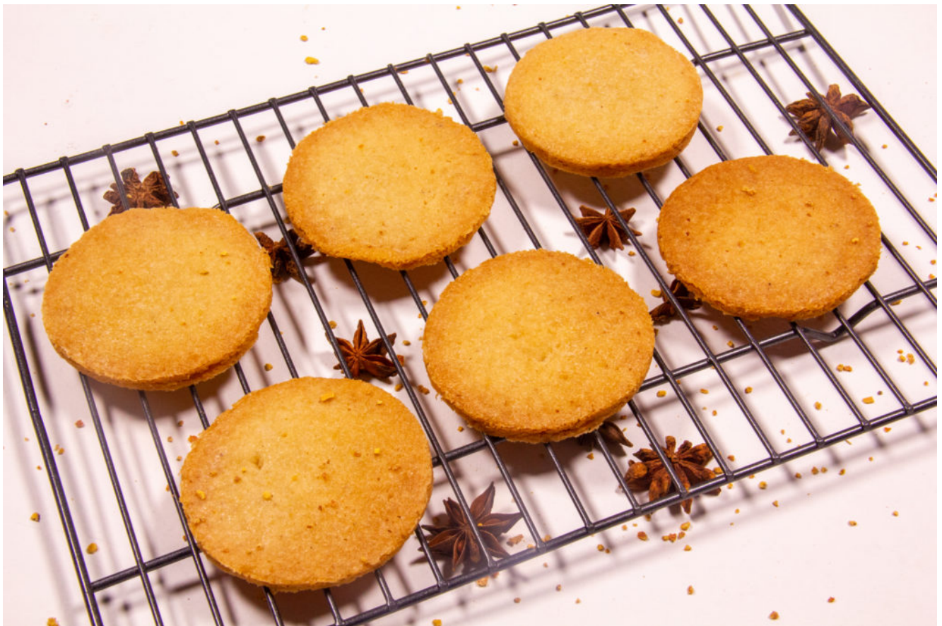
Sablés façon spéculos ( recette vidéoThermomix)