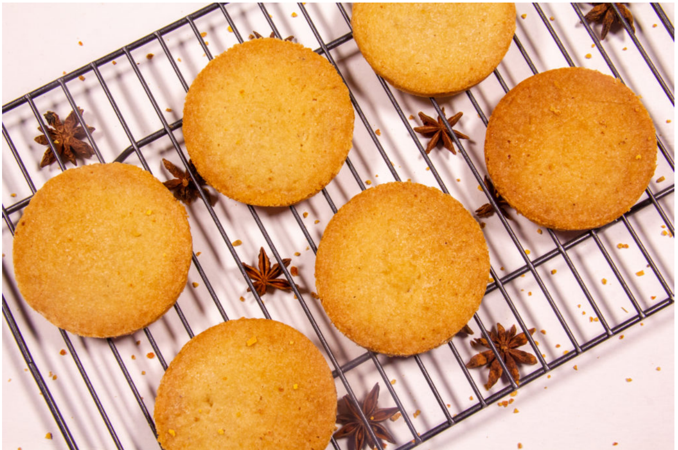
Sablés façon spéculos (recette vidéoThermomix)

Encore un peu de magie de Noël avec ces délicieux sablés réalisés en un clin d'œil grâce à votre Thermomix. Et le petit plus c'est que vous pouvez suivre et réaliser cette recette avec la vidéo complète en fin d'article!