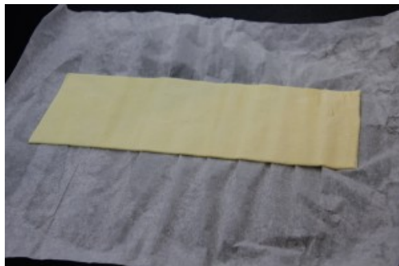
Détaillez la pâte feuilletée