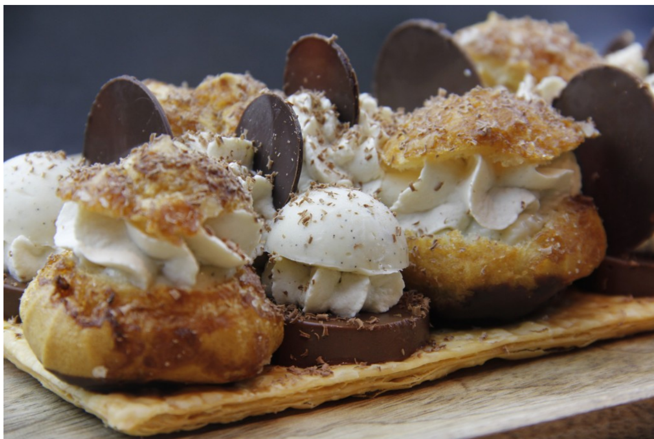
Saint Honoré au chocolat

Voici ma version revisitée du Saint Honoré... au chocolat.