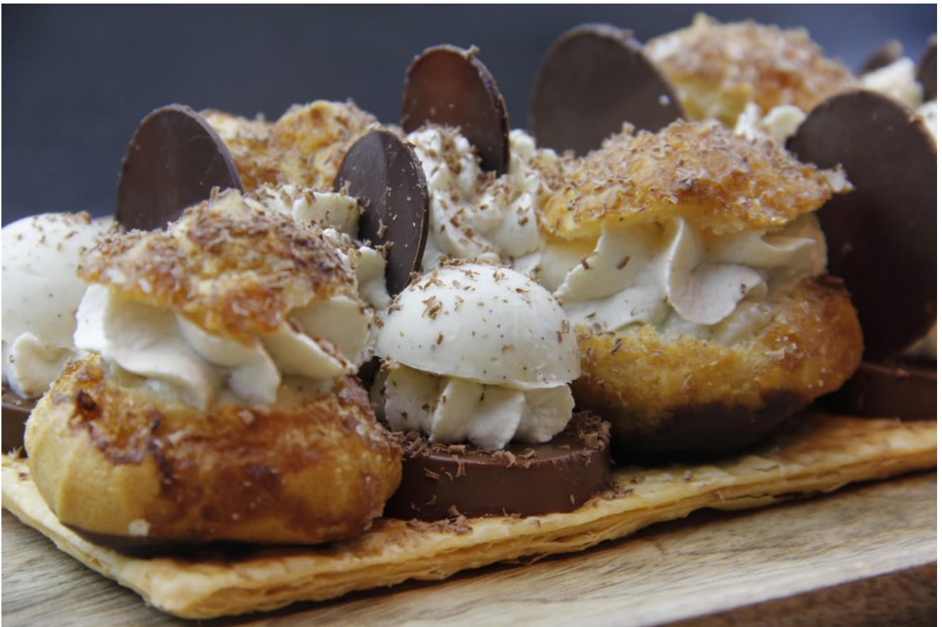
Saint Honoré au chocolat

Voici ma version revisitée du Saint Honoré... au chocolat.