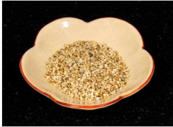
Graines de sésame torrifiées