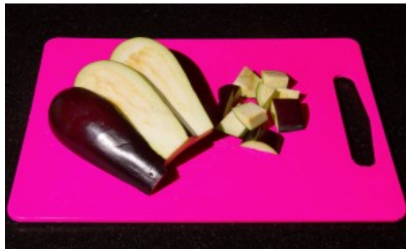
Tranchez les aubergines en long