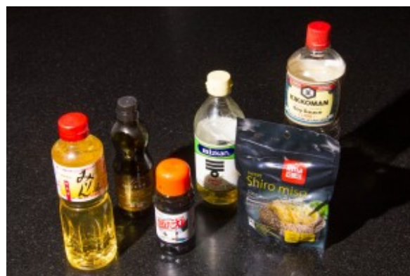
Ingrédients pour la sauce