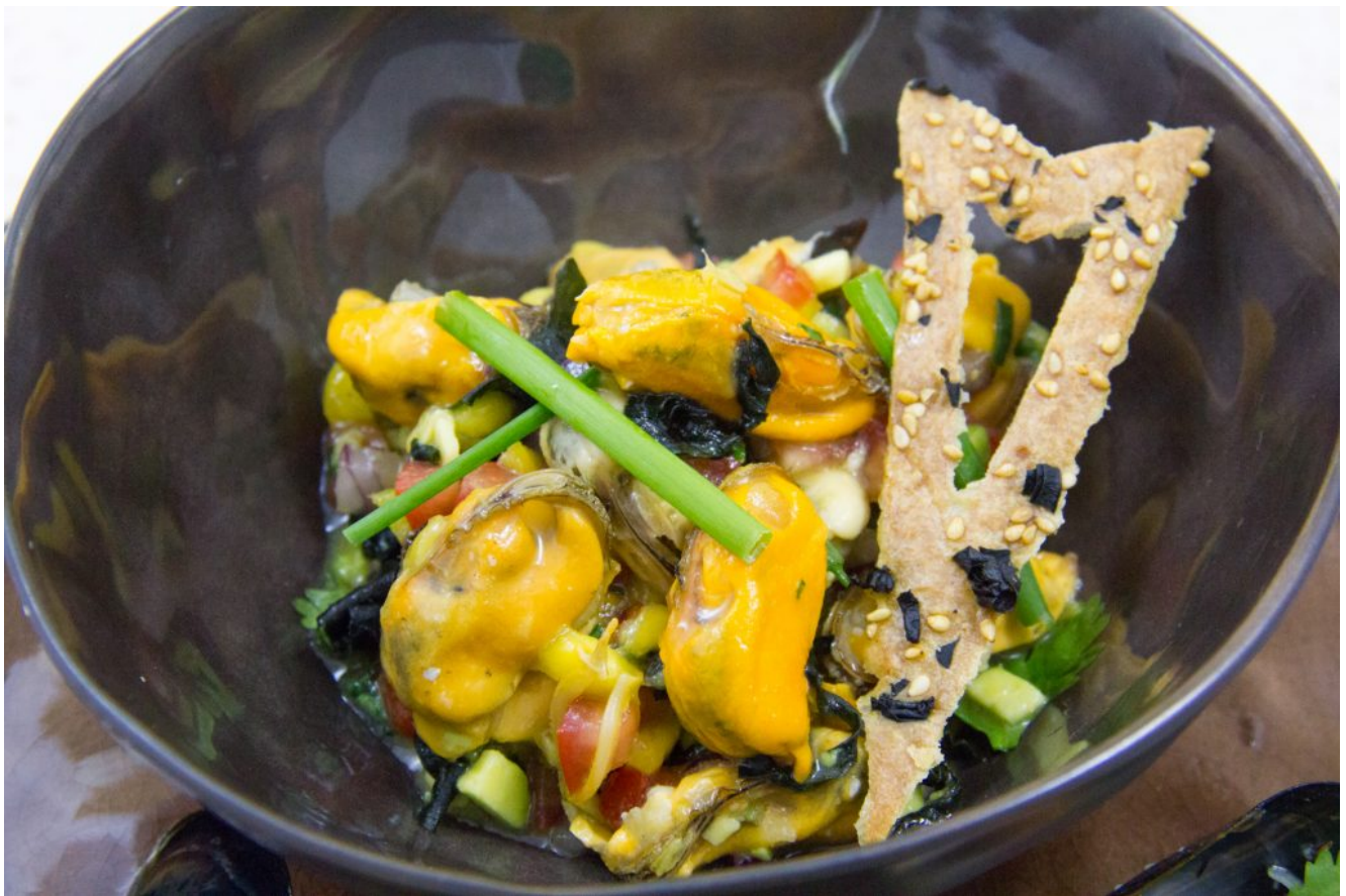
Salade fruitée de moules multicolore, crackers aux algues

Disposez une petite louche de salade dans des bols individuels. Puis décorez avec quelques brins de ciboulette, des moules en coquilles, quelques feuilles de coriandre