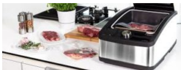
Home de Multivac