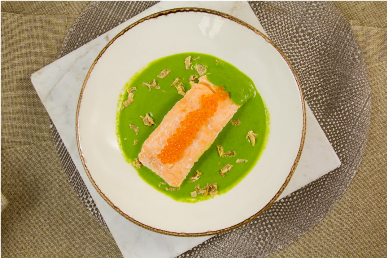
Saumon basse température en nage de persil