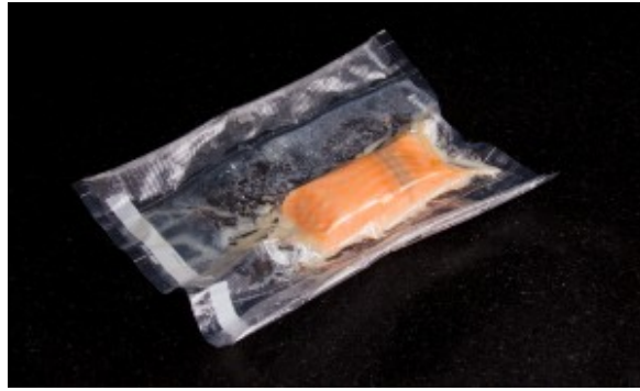
Saumon sous vide