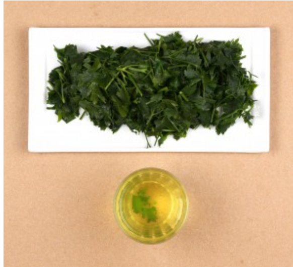
persil blanchi et son eau de cuisson