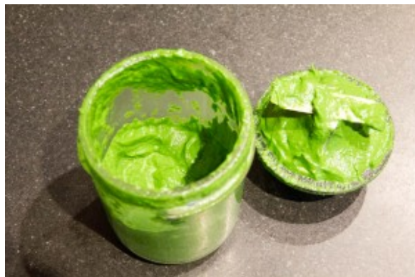
Mixez le persil