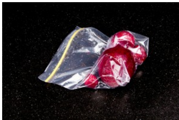
Betteraves sous vide