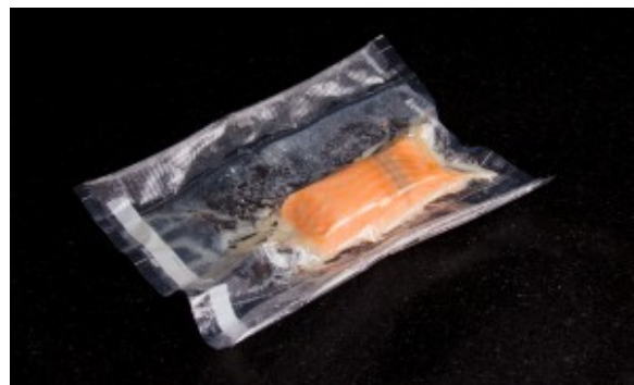
Saumon sous vide

Un fois cuit, laissez le saumon dans son sachet ( la chair est très fragile) et mettre au frais pour complet refroidissement.