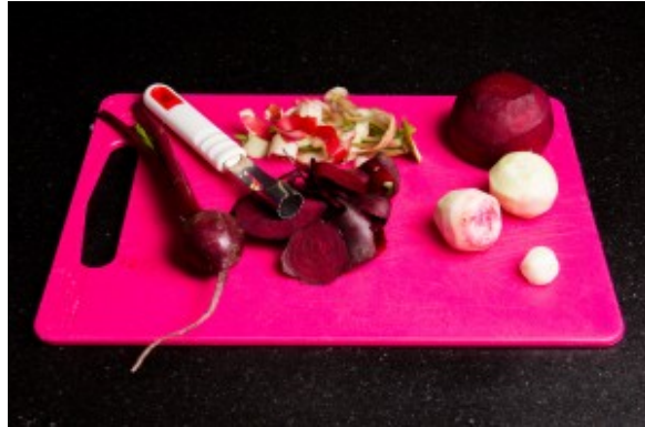
Épluchez les betteraves