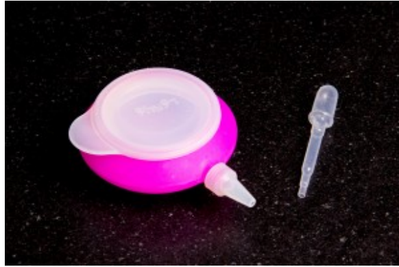
Decopen ( marque Lékué) et pipette