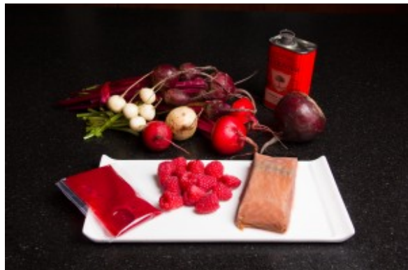
Ingrédients de la recette