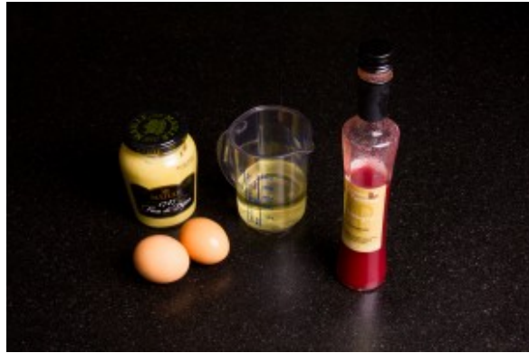
Ingrédients pour la mayonnaise