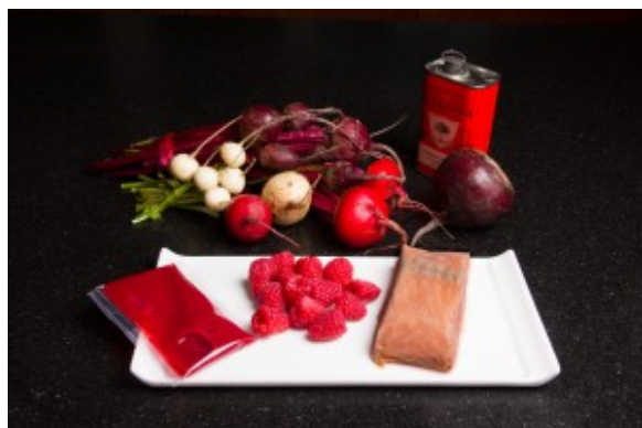
Ingrédients de la recette