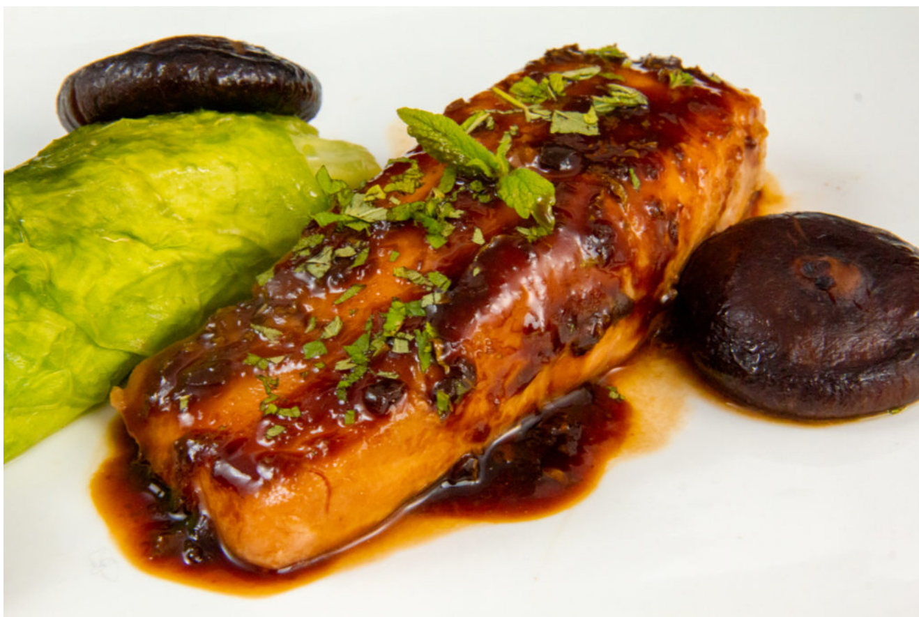
Saumon laqué au miso (recette basse température)

Un saumon inspiration japonaise , ça vous tente? Fondant et savoureux ce saumon a tout pour ravir vos papilles!