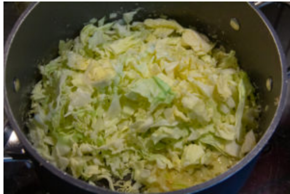
Ajoutez le chou

minutes jusqu'à ce qu'il soit fondant et ajoutez le chou ciselé. Cuisez encore quelques minutes: le chou doit être moelleux et incorporez les crevettes grises. Ôtez du feu et rectifiez l'assaisonnement en sel et poivre de votre choix.