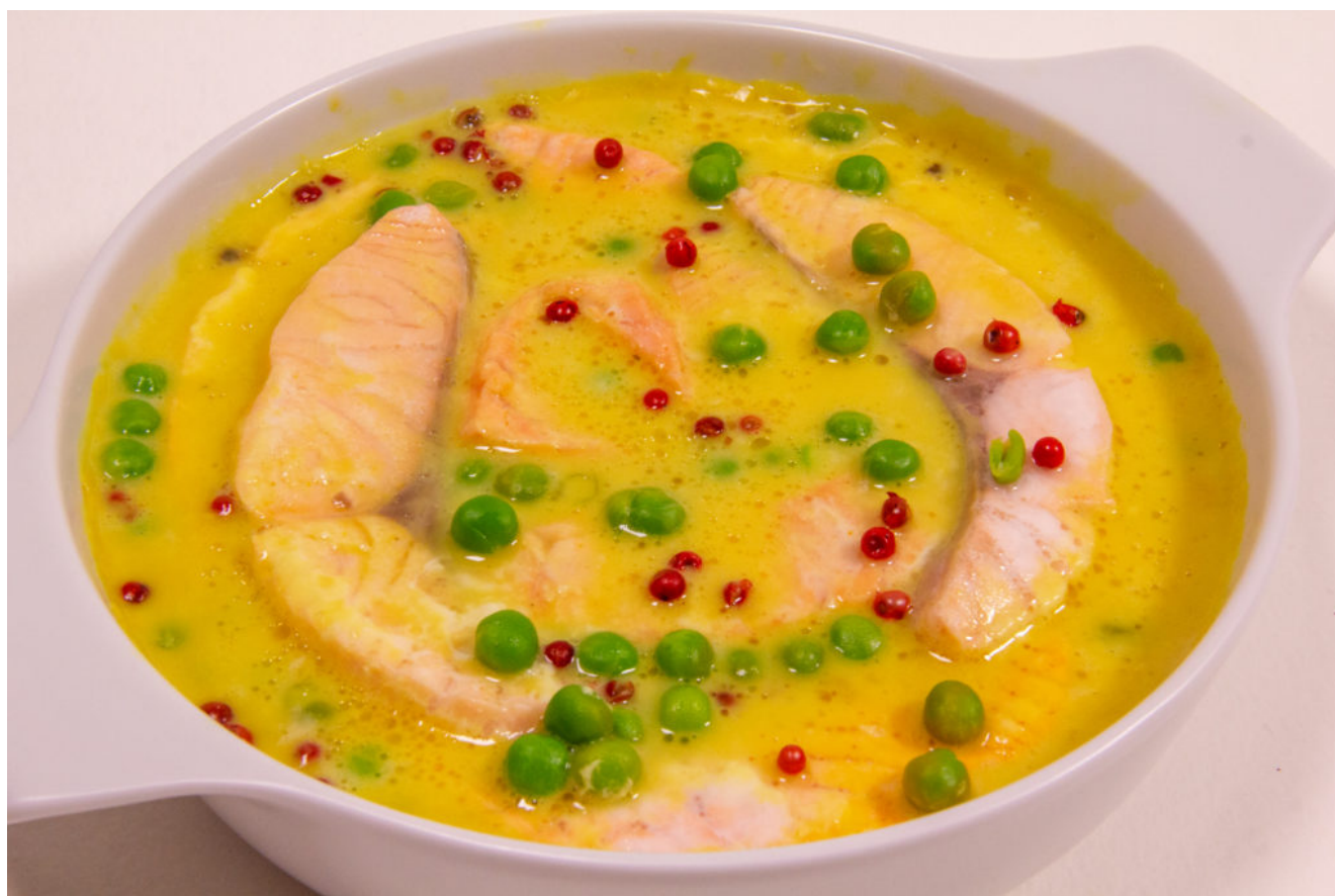
Saumon poché, petits pois (Recette menu Thermomix)