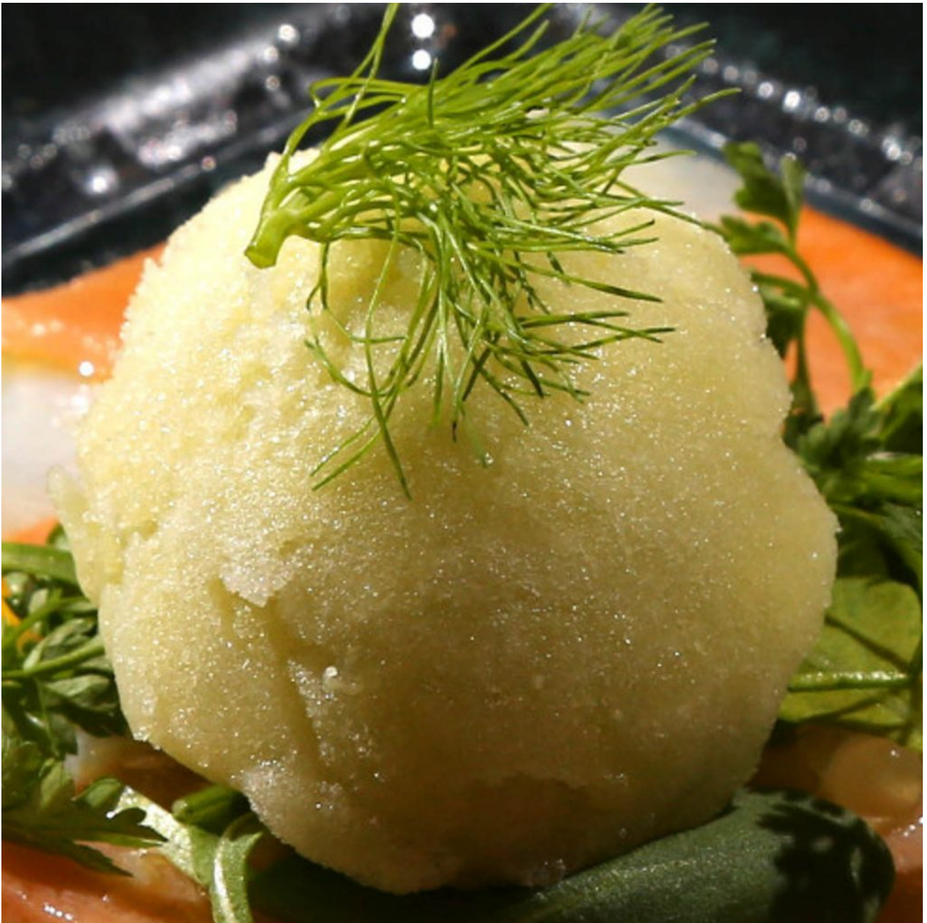
Sorbet surprenant au fenouil

Voici un très parfumé et étonnant sorbet au fenouil qui se marie parfaitement en été avec une salade de tomate, un carpaccio ou un tartare qu'il soit de viande ou de poisson... La préparation de cette recette se fait la veille en raison du passage en congélation.