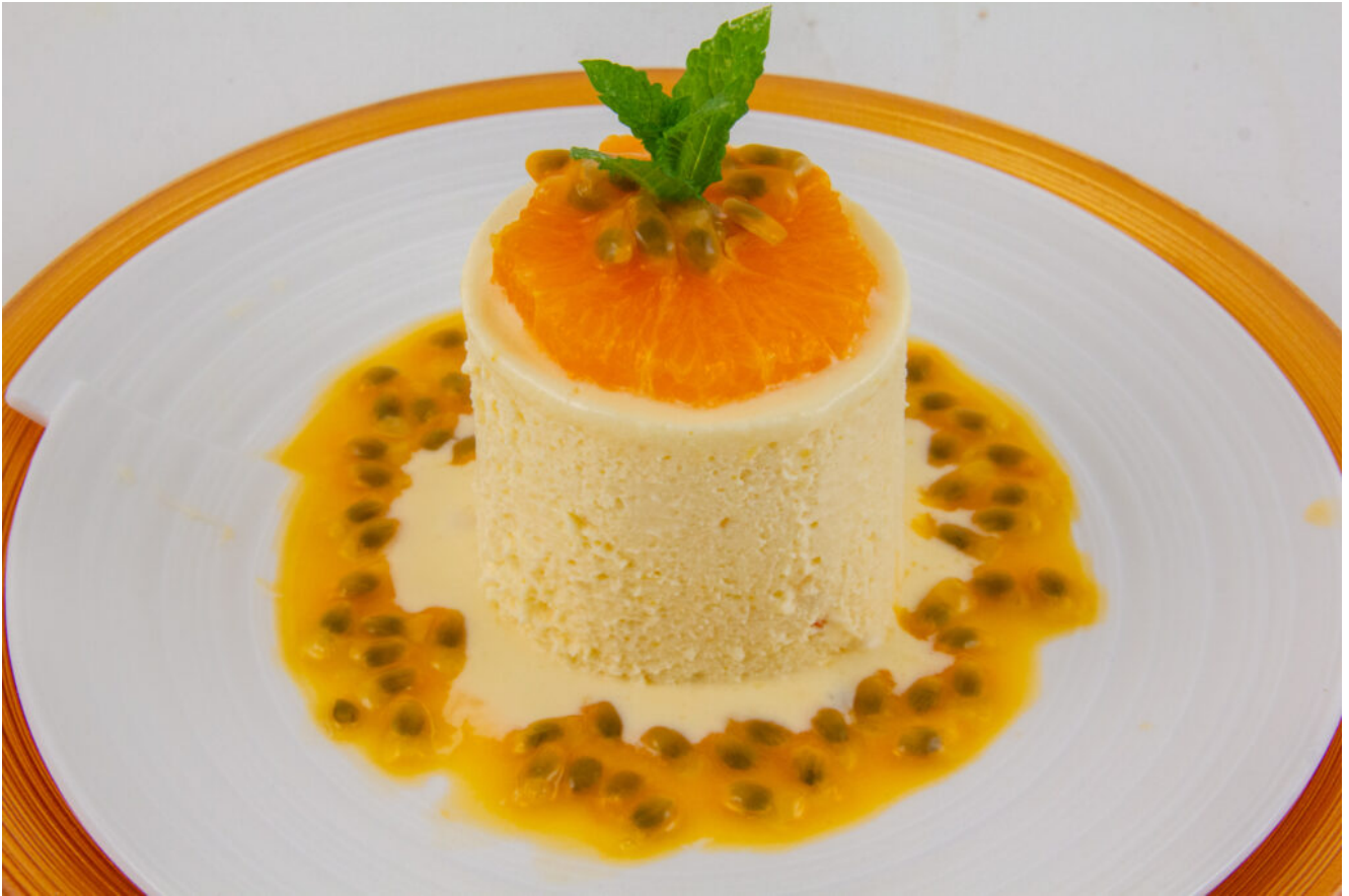
Soufflés glacés à la mandarine