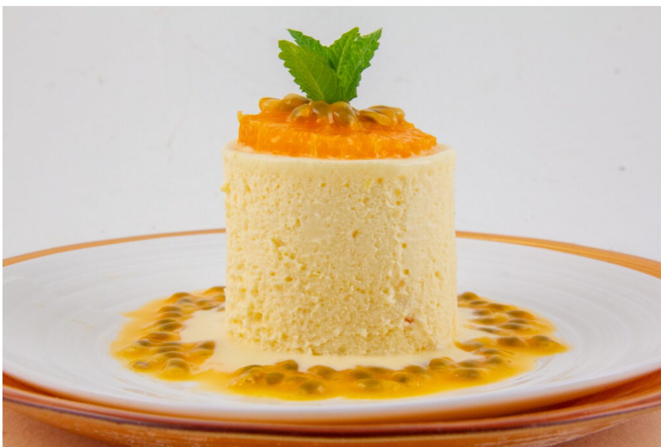
souffle froid mandarine

Aujourd'hui je vous propose un délicieux dessert que vous pouvez réaliser à l'avance puisqu'il faut le congeler. Ces Soufflés glacés à la mandarine demandent un peu de technique mais si vous avez les bons outils vous le réaliserez facilement. Et c'est une pure gourmandise!