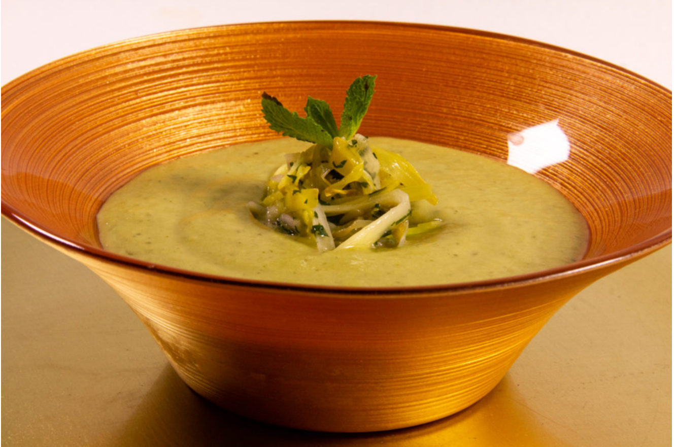
Soupe Poireaux Menthe (Thermomix)

Vous ne connaissez pas encore le Thermomix®, ce robot ménager le plus vendu en Europe et que tout le monde rêve d'avoir dans sa cuisine?