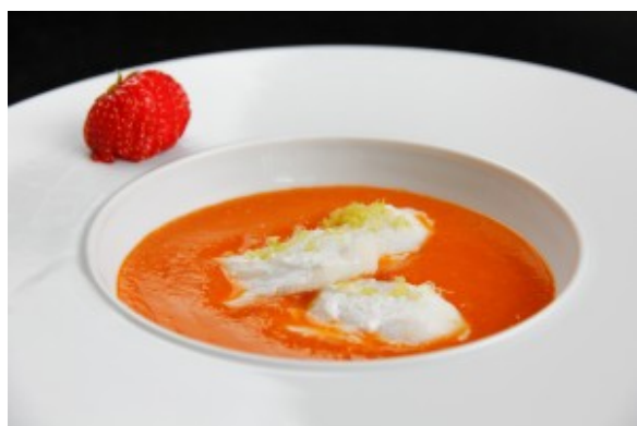
Soupe rafraîchissante tomates et fraises, pétales de cabillaud

Avec les chaleurs de l'été quoi de plus agréable qu'une entrée rafraîchissante: vous serez comblé avec cette soupe originale de tomate parfumée aux fraises. Pour en faire un plat complet je la sers soit avec des petites crevettes grises, soit avec un filet de cabillaud.