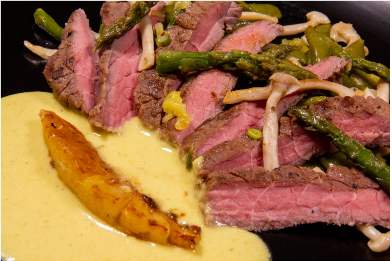
Steak d'autruche et ses petits légumes, sauce ananas

voire sauce. Disposez les légumes dans l'assiette et posez les tranches de steak d'autruche sur les légumes. Versez un peu de sauce et rajoutez la tranche d'ananas.