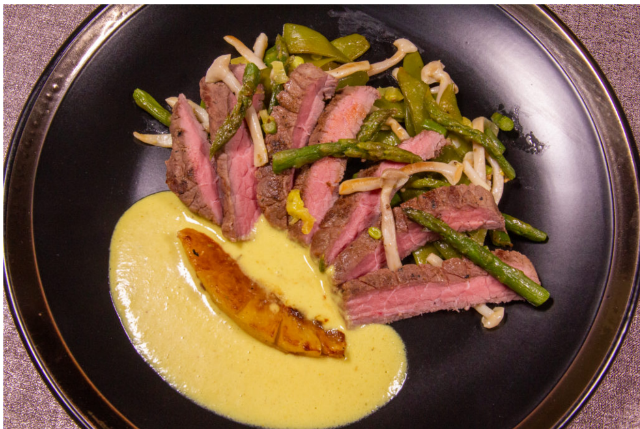
Steak d'autruche et ses petits légumes, sauce ananas

Il y a quelque temps déjà j'avais pu goûter de la viande d'autruche. C'est une viande de caractère comme une viande de gibier mais j'avais trouvé la texture trop ferme. J'ai donc testé cette viande en cuisson sous vide basse température et là... Topissime: une tendreté exceptionnelle avec une chair qui fond en bouche. Je vous propose donc aujourd'hui un « Steak d'autruche et ses petits légumes, sauce ananas ».