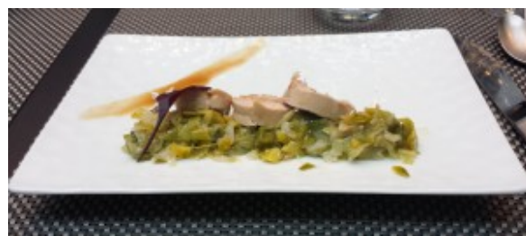
Suprêmes de pintade, fondue