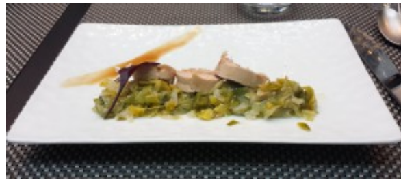
Suprêmes de pintade, fondue de poireaux