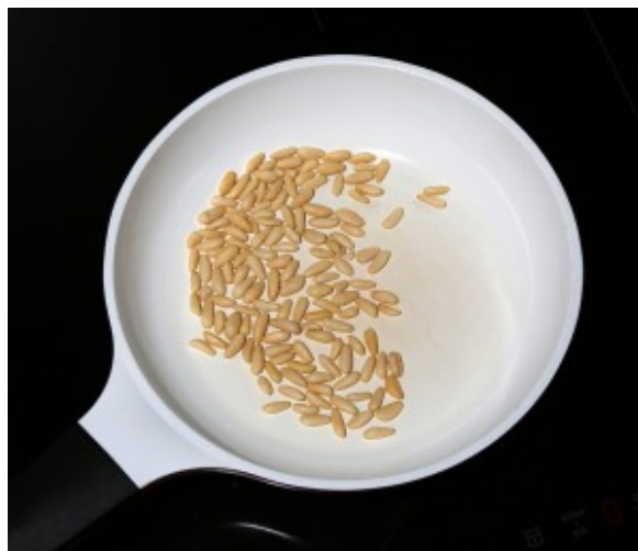
Faire revenir les pignons