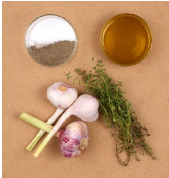
Ingrédients ail confit