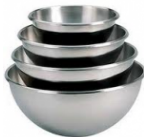
Cul de poule