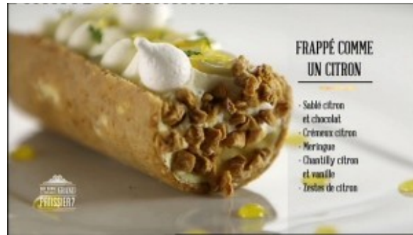
Frappé comme un citron