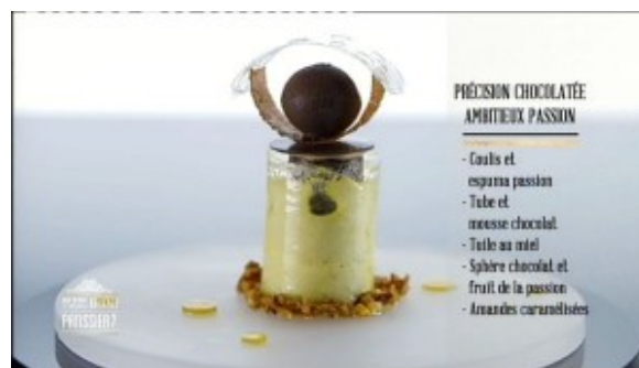
Précision chocolatée Ambitieux passion