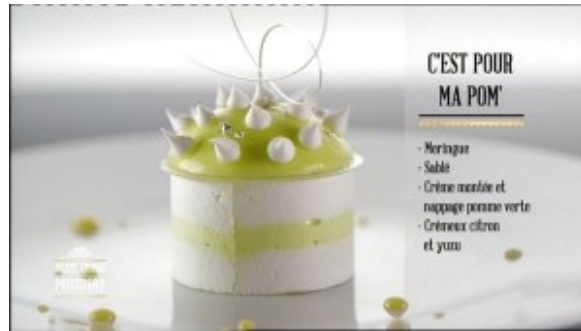
C'est pour ma pom'