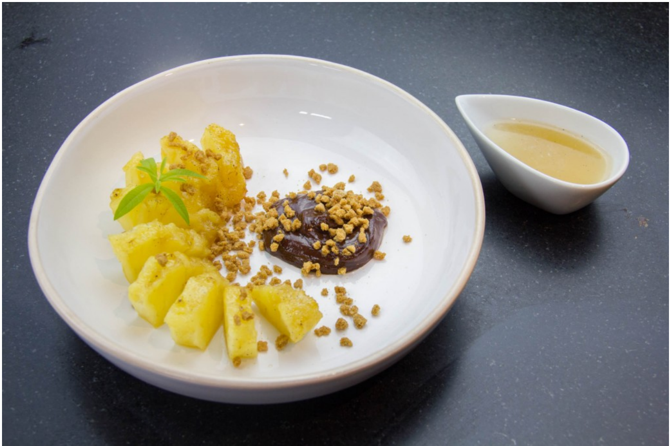
Ananas au sirop d'épices, cuisson basse température