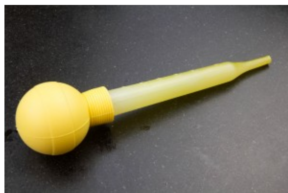
pipette à sauce