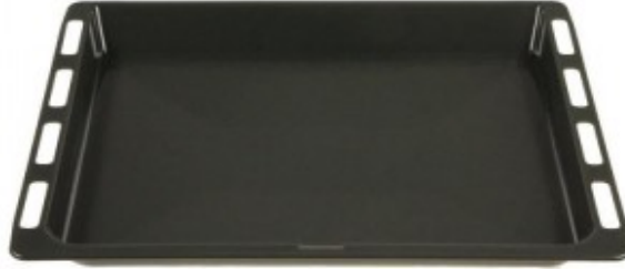
plat lèche frite