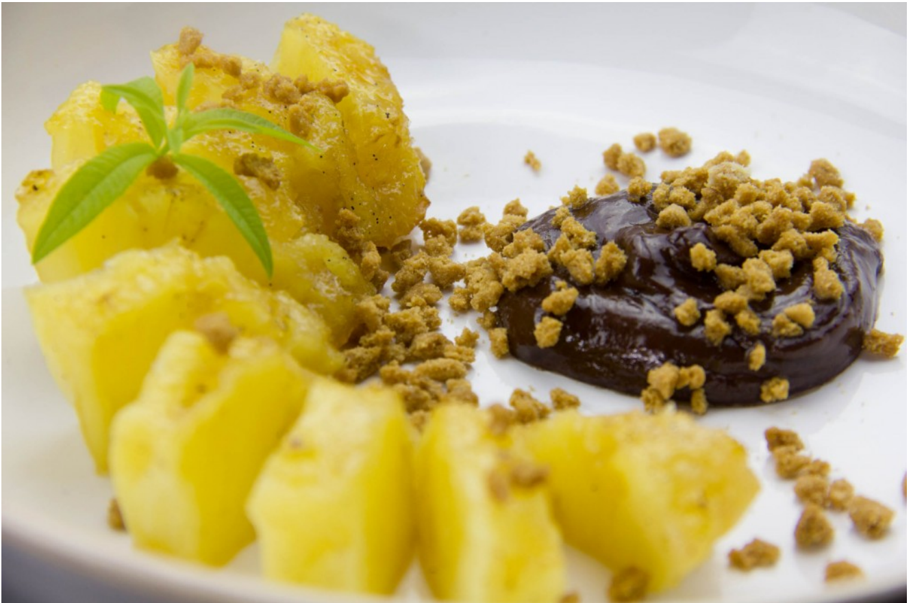
Ananas au sirop d'épices, cuisson basse température