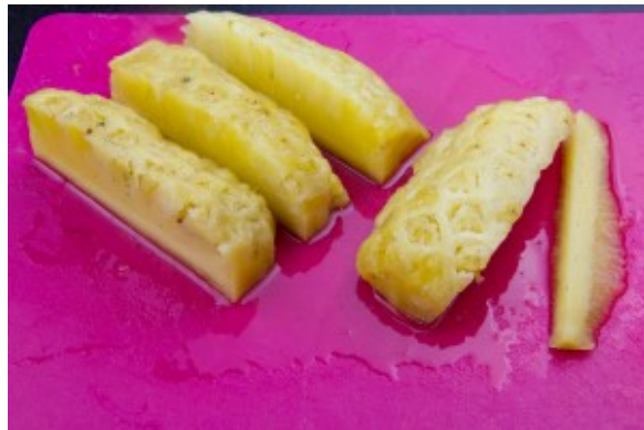
Coupez l'ananas en quatre