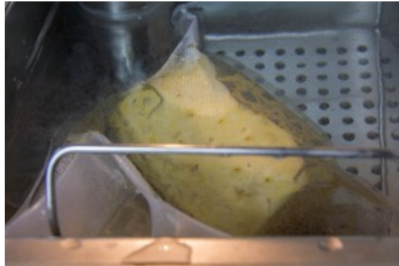
Cuire l'ananas sous vide basse température