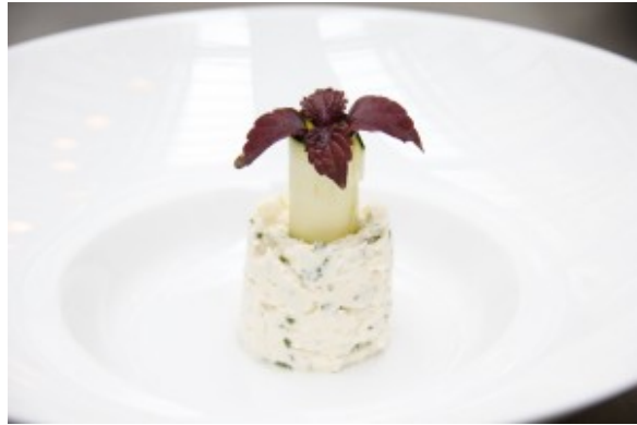
pousse de shiso