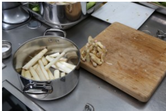
Préparez les asperges